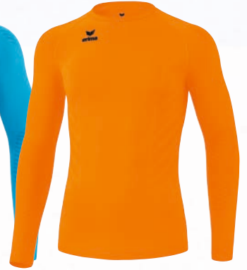
2252127 new orange