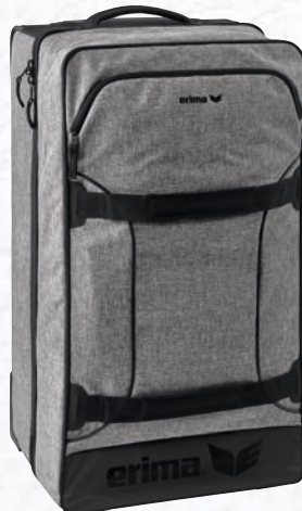
Gr. M 7231801 grau melange