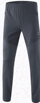
8102302 slate grey