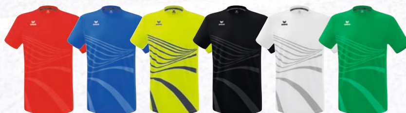
8082301 rot 8082302 new royal 8082306 primrose 8082304 schwarz 8082305 new white 8082303 smaragd