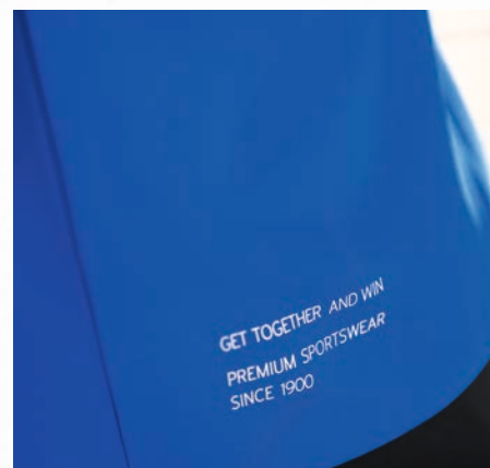
ERIMA SLOGAN AM RÜCKENTEIL