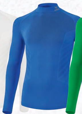
2252113 new royal