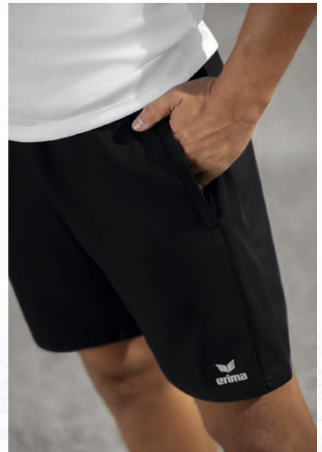
LEICHTES, ELASTISCHES FUNKTIONSMATERIAL FÜR EIN KÜHLES TRAGEGEFÜHL