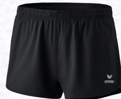
Herren/Kinder: 109611 schwarz