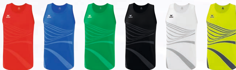
8282301 rot 8282302 new royal 8282303 smaragd 8282304 schwarz 8282305 new white 8282306 primrose