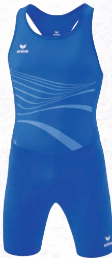
8292318 new royal