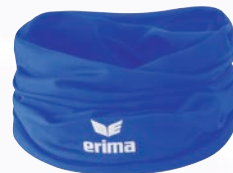
3242004 new royal