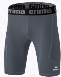
3292301 slate grey