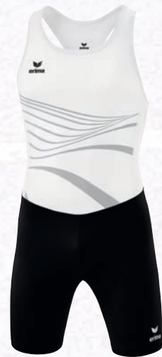
8292321 new white