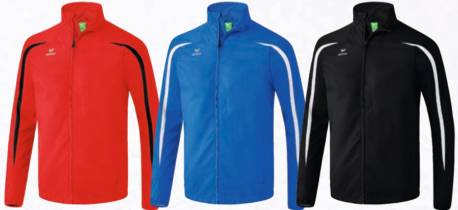
Herren/Kinder: 8060704 Damen: 8060701 rot/schwarz