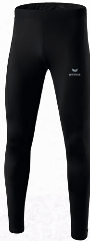
Herren/Kinder: 8290701 schwarz