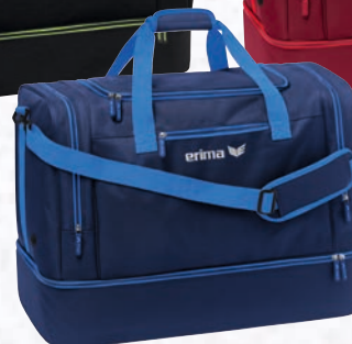
7232122 new navy/new royal