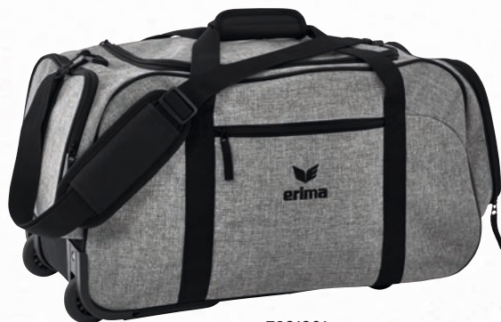
7231901 grau melange/schwarz

7231901 Gr. S EUR 54,99* 7231901 Gr. M EUR 79,99*