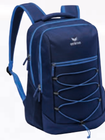
7232126 new navy/new royal