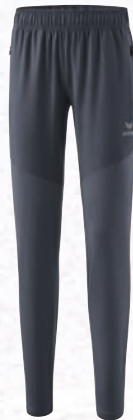
8102304 slate grey