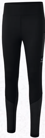
Damen: 2292201 schwarz