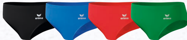
809901 schwarz 829407 new royal 829408 rot 829508 smaragd