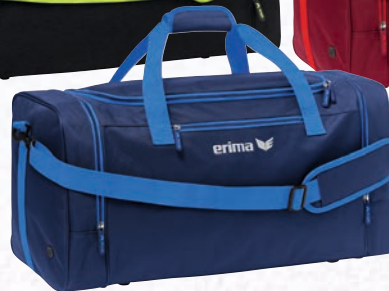
7232118 new navy/new royal