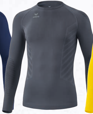
2252107 slate grey