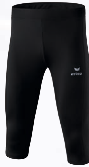
Herren/Kinder: 8290702 schwarz