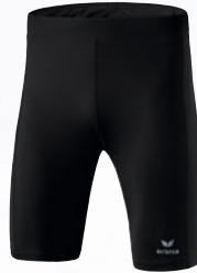
Herren/Kinder: 8290703 schwarz