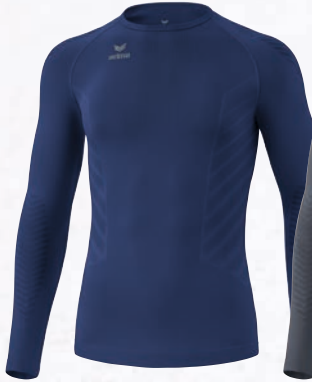
2252106 new navy