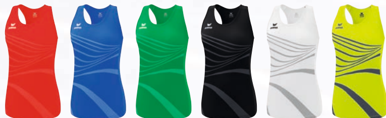
8282307 rot 8282308 new royal 8282309 smaragd 8282310 schwarz 8282311 new white 8282312 primrose