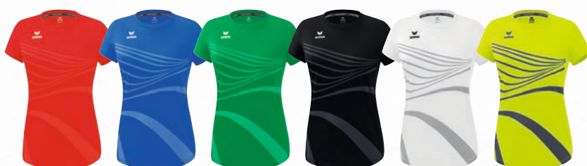
8082307 rot 8082308 new royal 8082309 smaragd 8082310 schwarz 8082311 new white 8082312 primrose