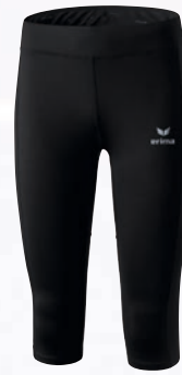
Damen: 8290707 schwarz