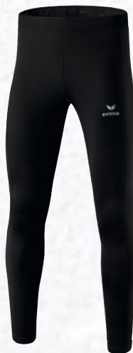
Herren/Kinder: 8290704 schwarz