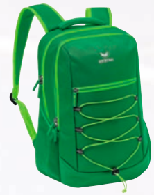
7232127 smaragd/fern green