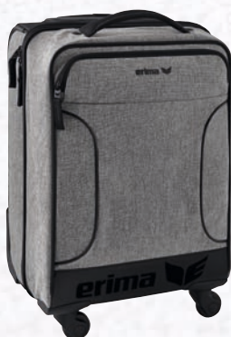
Gr. S 7231801 grau melange

7231801 Gr. S EUR 179,99* 7231801 Gr. M EUR 199,99* 7231801 Gr. L EUR 219,99*