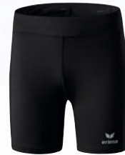
Damen: 8290708 schwarz