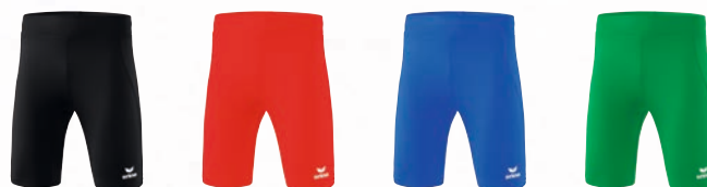
8292301 schwarz 8292302 rot 8292303 new royal 8292304 smaragd