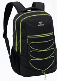
7232124 schwarz melange/limo