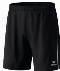
Herren/Kinder: 809600 schwarz