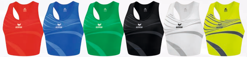
8282313 rot 8282314 new royal 8282315 smaragd 8282316 schwarz 8282317 new white 8282318 primrose