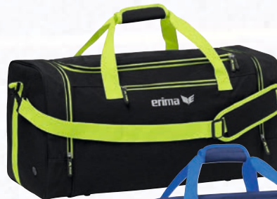
7232116 schwarz melange/limo

7232116-7232119 Gr. M EUR 44,99* 7232116-7232119 Gr. L EUR 49,99*