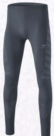
2292301 slate grey