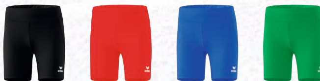
8292305 schwarz 8292306 rot 8292307 new royal 8292308 smaragd