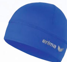
8122002 new royal