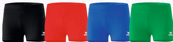
8292309 schwarz 8292310 rot 8292311 new royal 8292312 smaragd