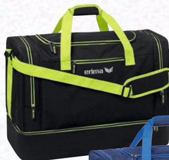
7232120 schwarz melange/limo

7232120-7232123 Gr. M EUR 49,99* 7232120-7232123 Gr. L EUR 54,99*