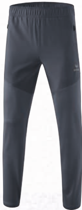
8102302 slate grey