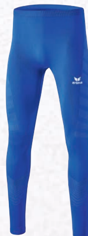
2290702 new royal