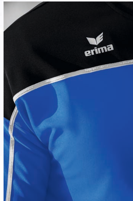
LEICHTES, ELASTISCHES FUNKTIONSMATERIAL