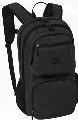
7232335 grau melange/schwarz