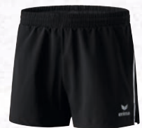
Damen: 809601 schwarz