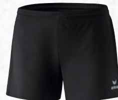
Damen: 809821 schwarz