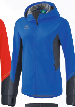
8062306 new royal