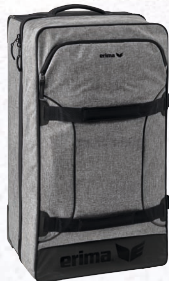
Gr. L 7231801 grau melange