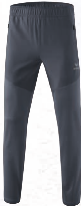
8102302 slate grey