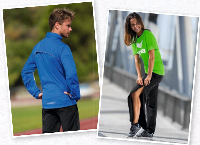
8060706 8060703 schwarz/weiß