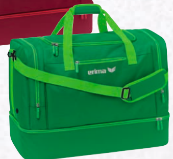
7232123 smaragd/fern green