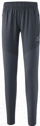
8102304 slate grey