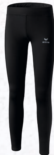
Damen: 8290706 schwarz