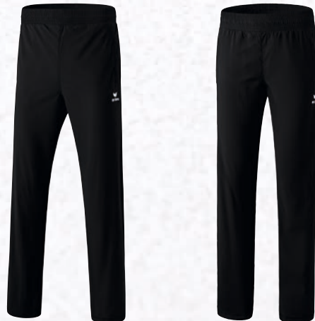
Herren/Kinder: 8100702 schwarz