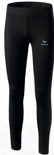
Damen: 8290705 schwarz