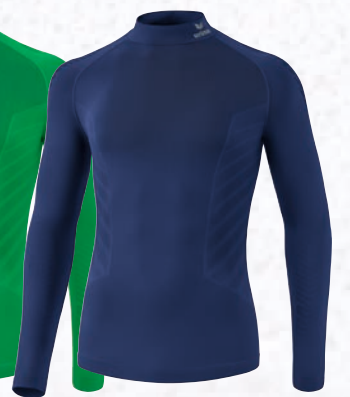
2252115 new navy