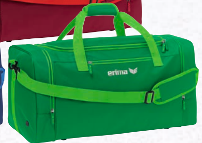
7232119 smaragd/fern green